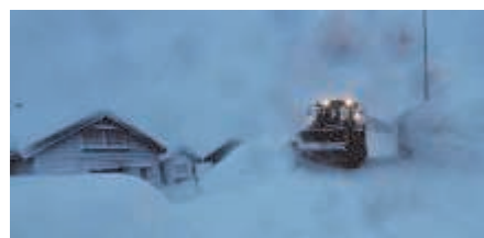
Brøytemannskapene har hatt en travel og utfordrende vintersesong.

Her samles masse folk, og det er viktige aktiviteter og er med på å skape gode møteplasser i dalen.