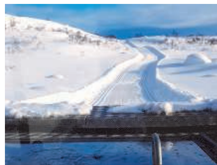
Sirdalsløyper har presentert veldig flotte løyper - til glede for innbyggere og besøkende.