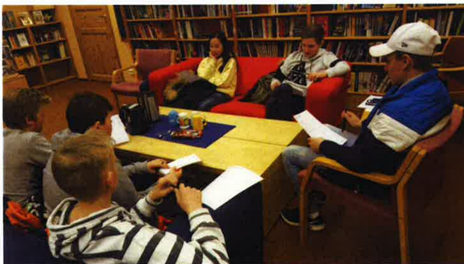
Ungdomsrådet vurderer hva som er viktige forutsetninger for at de skal velge Sirdal som framtidig bosted.