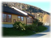
Kindergarten im oberen Sirdal