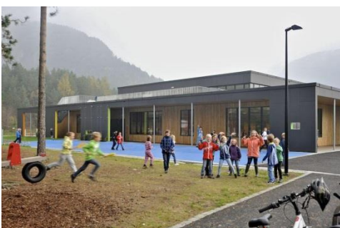
Die neue Schule in Tonstad

Die Erwachsenenbildung ist in Tonstad lokalisiert. Gelehrt wird Norwegisch und Gemeinschaftskunde für erwachsene Einwanderer. Außerdem wird Grundschul- und Spezialunterweisung für Erwachsene angeboten.