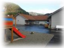
Kindergarten in Tonstad