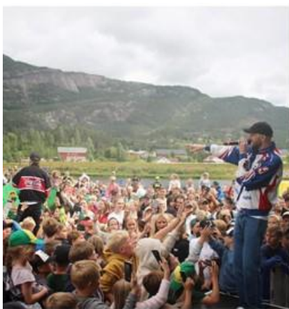
Familiekonsert med Hagle