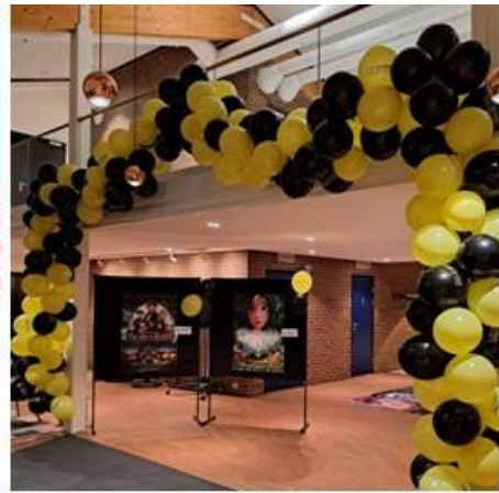
Fra Den Store Kinodagen