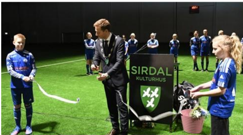
Fra åpningen av fotballhallen