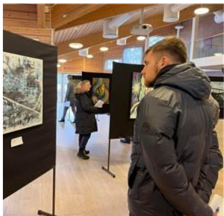
Kunstutstilling i kulturhuset