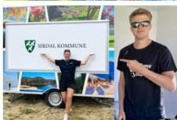
Sommervikarer og stor aktivitet i forbindelse med Heimesommer 2023