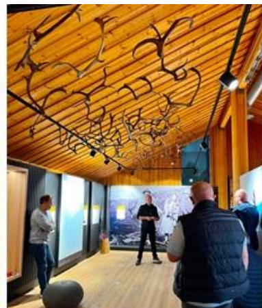
Åpning av Villreinutstillinga