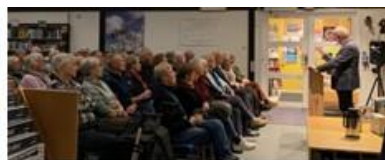
Forfatterbesøk på biblioteket